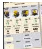
Таблица выбора насосов для моментных ключей

Для достижения оптимальной скорости и производительности следует обратиться к таблице выбора моментного ключа и шлангов.